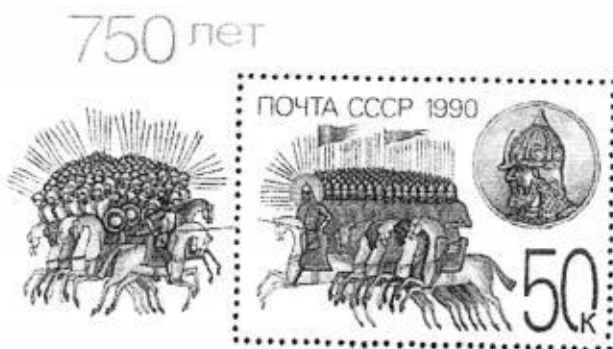
„И бысть сѣра БСАНКА...“

Задание 5. Внимательно изучите предложенные изображения. Определите, какие события изображены на почтовых марках, укажите годы, когда они произошли, а также назовите одного исторического деятеля-участника каждого из указанных событий. Внесите ответы в таблицу.